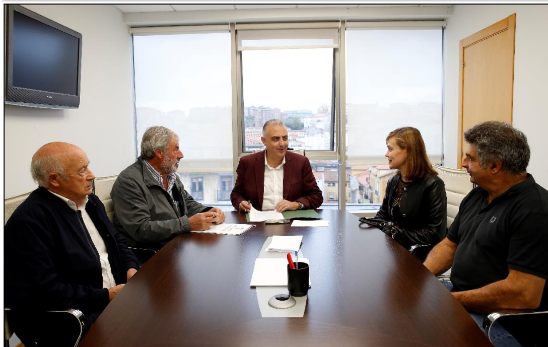
Foto: Reunión Consejero de Fomento y miembros de la corporación municipal de Valderredible.

La inversión prevista asciende a un total de 373.694,59 euros