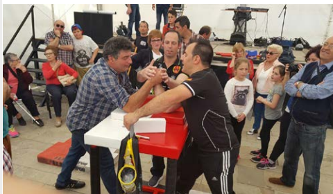
Lucha de brazos