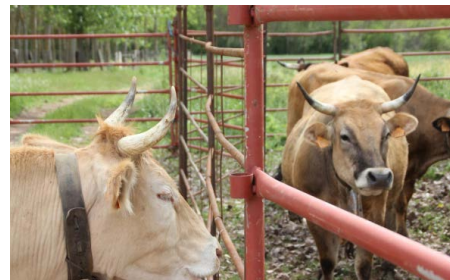
Exposición de ganado bovino