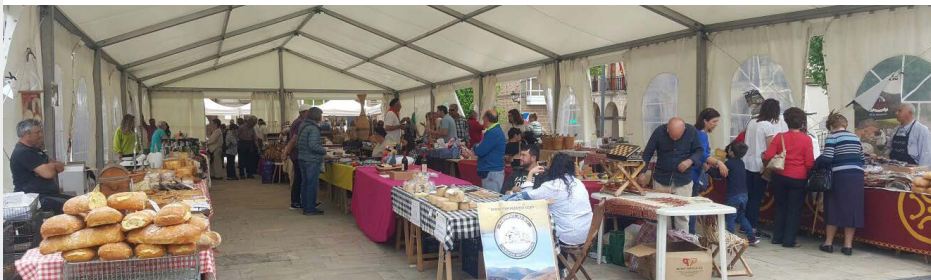
Mercado de artesanos