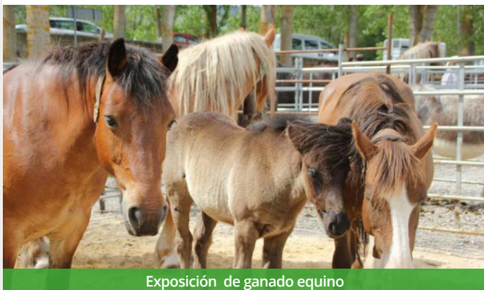
Exposición de ganado equino