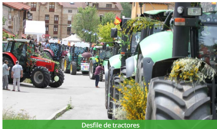
Desfile de tractores