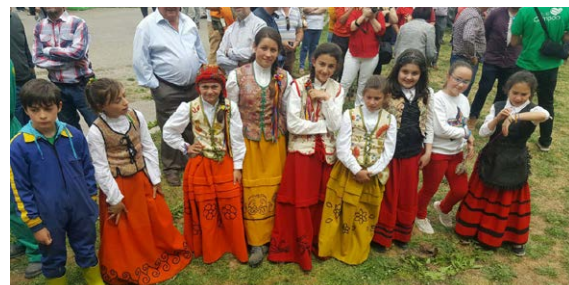
El futuro de Valderredible