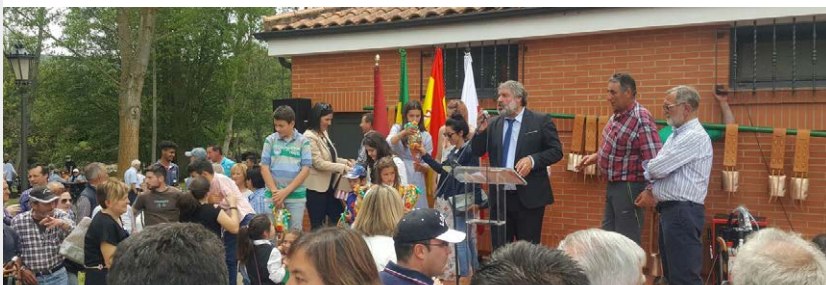
Entrega de premios